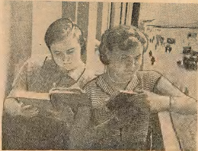
Перад апошнім экзаменам.