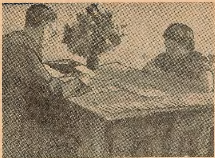
Экзамен па асновах марксізма-ленінізма на I курсе філфака прымае кандыдат філасофскіх навук В. М. Сікорскі.